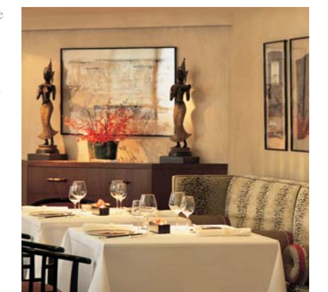
The Oriental Restaurant

Блюда итальянской кухни подаются в неофициальной атмосфере зала из бело-голубой плитки, созданному по проекту декоратора интерьеров Alberto Pinto. Пьяно-бар с 18.30 каждый вечер, джаз со среды по субботу. The Bar открыт с 11.00 до полуночи, с понедельника по субботу, с 12 до 22.30 по субботам.