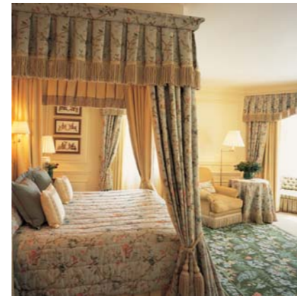
Сьют в Dorchester (снимок вверху и внизу)

250 индивидуально спроектированных однокомнатных, двухкомнатных номеров и сьютов в традиционном стиле английского загородного дома, характерной чертой которого являются специально изготовленные ткани, антикварная мебель и оригинальные предметы искусства. Из всех номеров открывается вид либо на Hyde Park, либо на ландшафтные террасы Дорчестера. Имеются номера для некурящих. Некоторые ванны комнаты снабжены гидромассажными ваннами. 195 номеров с двумя односпальными/двухспальными кроватями. 55 сьютов, 4 из которых с садом на крыше (Roof Garden Suites) и два апартамент-пентхауз.