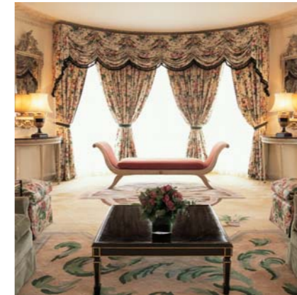
The Oliver Messel Suite

8 сьютов Park Suites выходят прямо на зеленые просторы Hyde Park. Длинные, прямоугольной формы, отделанные деревянными панелями гостиные с доходящими до пола двухстворчатыми окнами и узким балконом, они имеют богатое убранство – написанные маслом картины, gobelены и прекрасные ткани в лучших традициях английского загородного дома. Эти сьюты могут располагать как одной, так и двумя спальнями. В каждом номере имеются две ванны комнаты, некоторые из них оснащены гидромассажными ваннами.