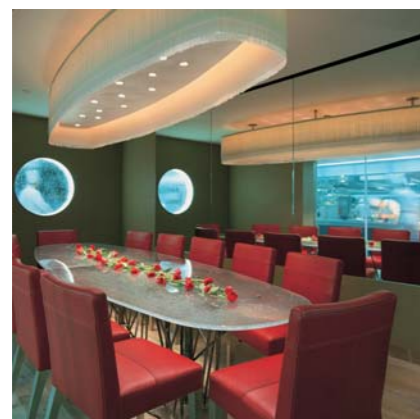
The Krug Room

Изысканный бело-бледно-голубой зал, спроектированный Oliver Ford в стиле, напоминающем Wedgwood. Идеальна для проведения танцевальных вечеров, конференций, встреч и коктейлей.